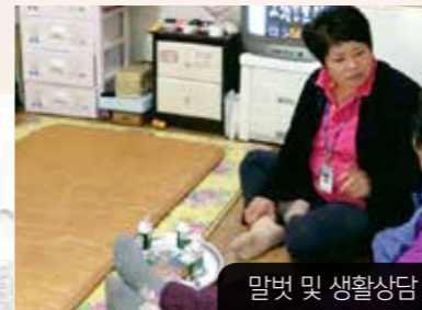
말벗 및 생활상담