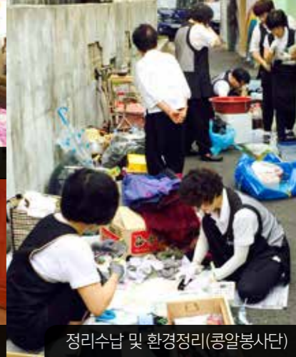
정리수납 및 환경정리(콩알봉사단)